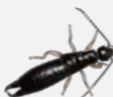
ひげじろはさみむし