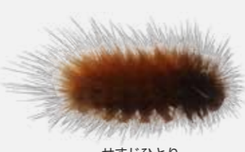
せすじひとり ようちゅう