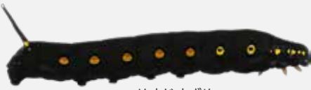
せすじすずめ ようちゅう