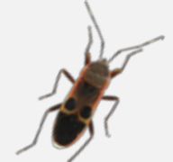
おおほしかめむし