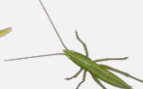
くびきりぎす ようちゅう