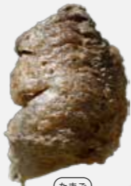
たまご かまがりのたまご