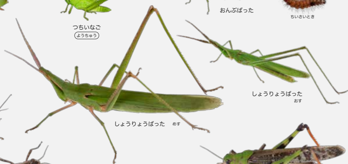
しょうりょうばった めす