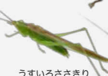
うすいろささきり