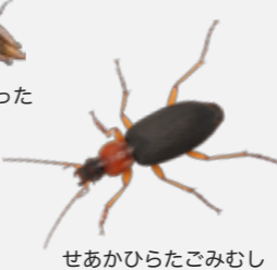
せあかひらたごむし