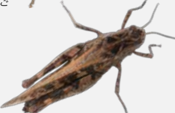
くまばったもどき