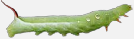
こすずめ ようちゅう