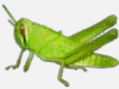
つちいなご ようちゅう