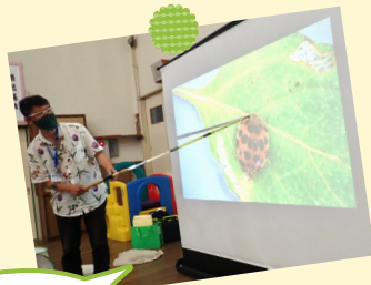
身近な虫を もっと楽しむ!