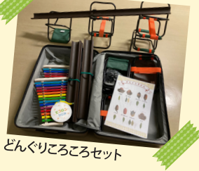
どんぐりころころセット