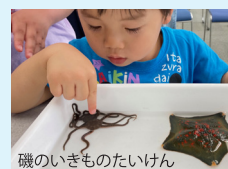
磯のいきものたいけん

初夏の夜なら… セミナリエ(セミ羽化観察) 海の近くなら… 磯のいきものたいけん など