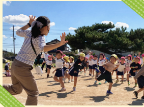
② どんぐりたいけん