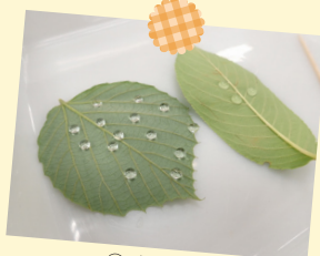
④ 水のふしぎたいけん