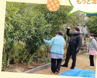
近くの公園の 草木でもっと遊べる!