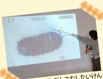
① だんごむしたいけん