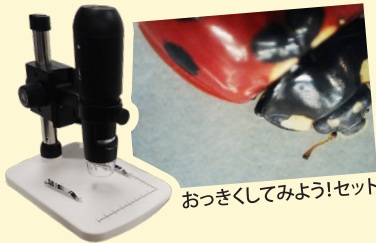
おつきしてみよう!セット