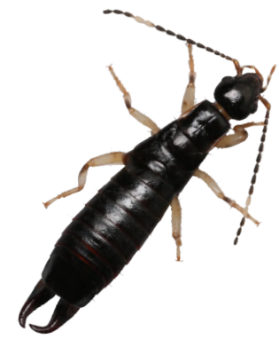
ひげじろはさみむし