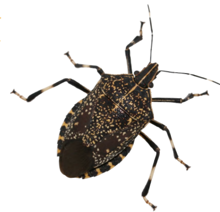
きまだらかめむし