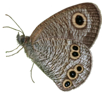
ひめうらなみじやのめ

おめめみたい はねに まるが いっぱい ちいさな ちょうちよ ひめうらなみじやのめ