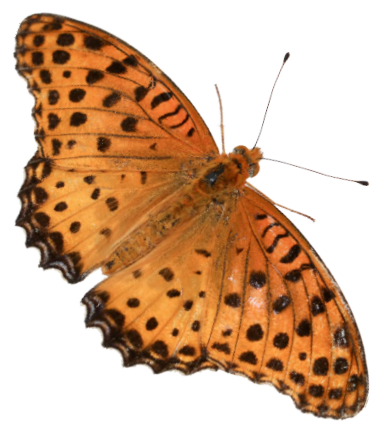
つまぐるひょうもん (おす)

よこしま もようの ぱんつが かわいいね さがが つんと ちいさな あらかしのどんぐり ☆かくこのことをぱんつとくもいふぢー!