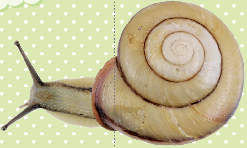
くちべにまいまい