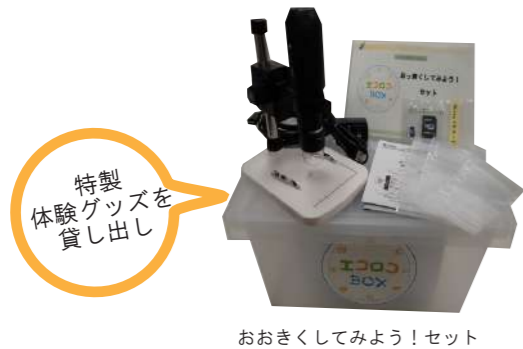
おおきくしてみよう!セット

エコロコ特製の体験グッズを貸し出し、各園の先生が実演し、こどもたちにじっくり体験する機械を提供しました。