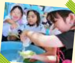
水のふしぎたいけん