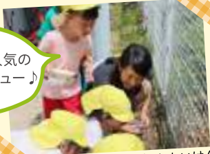
だんごむしいけん