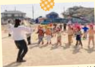
どんぐりたいけん・まつぼっくりたいけん